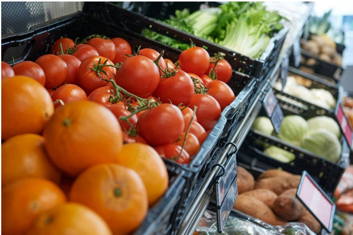
Mise en place de l'offre de fruits et légumes à l'Epicerie Caritas d'Emmenbrücke @ GCM

Le projet sera par conséquent poursuivi en 2026. Des partenariats fiables constituent la base du financement et de la stabilité de l'offre. En même temps, il s'agira d'étudier soigneusement de nouvelles coopérations, afin de garantir la pérennité de l'offre et son développement en fonction des besoins.