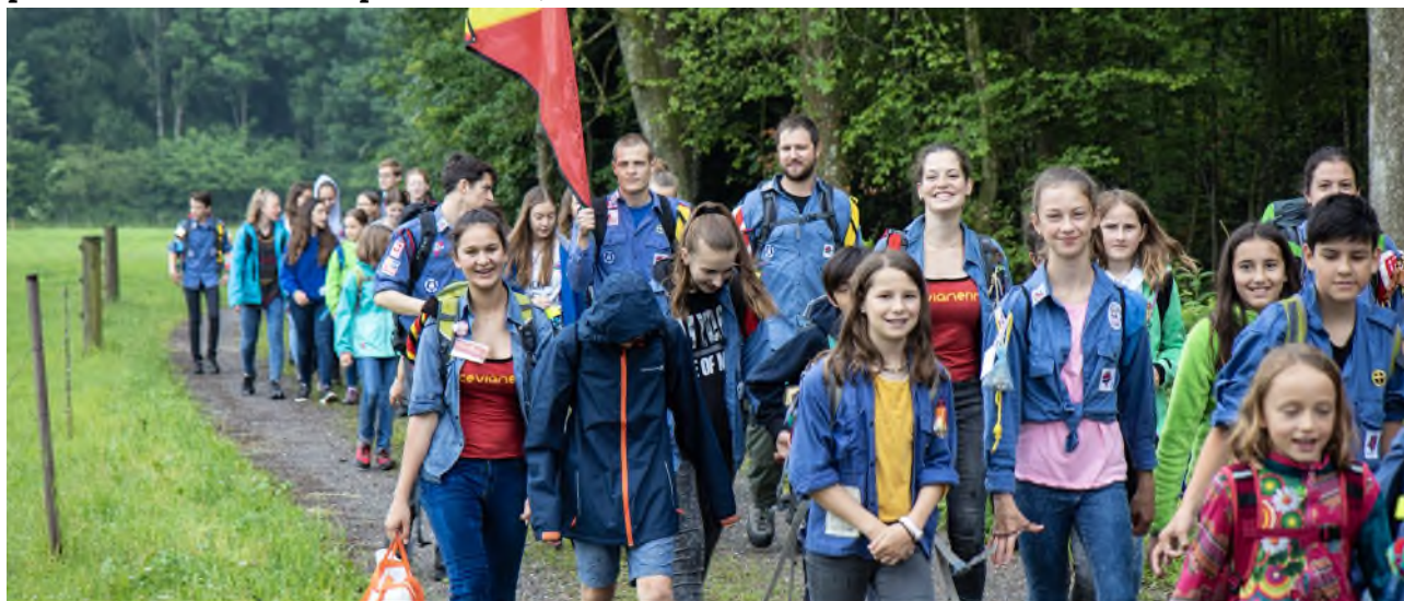
Sektionstrefftag Zürich Oberland 2019

Un tel événement nécessite une planification minutieuse, une logistique importante et des moyens financiers considérables. Afin que le plus grand nombre possible d'enfants et d'adolescents puissent y participer, quelle que soit leur situation financière, les U.C. Suisses dépendent du soutien de partenaires, de fondations et de donateurs.