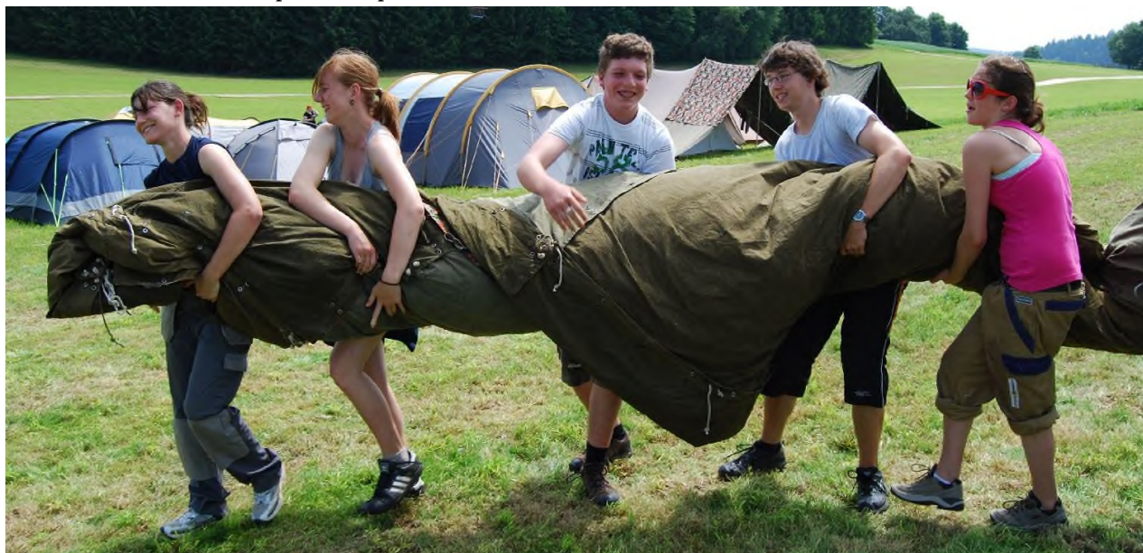
Ensemble, nous façonnons notre avenir – Conveniat 2009

Dans son ensemble, le rapport montre comment le conveniat27 a mis en œuvre et concrétisé ses objectifs, notamment la communauté comme école de vie, le développement des compétences et du leadership, ainsi que l'unité dans la diversité.