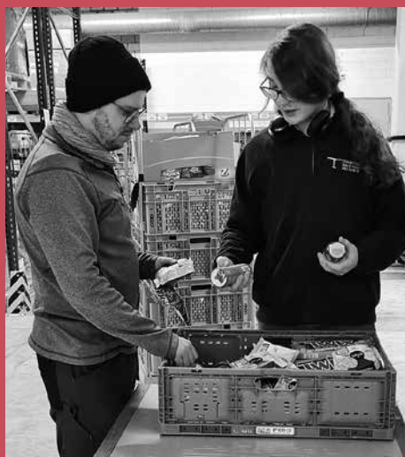
Sur la plateforme logistique de Winterthour, les apprenants se chargent d'importantes tâches logistiques.

C'était l'idée maîtresse de la collaboration. Durant leur formation, divisée en plusieurs volets, les jeunes interviennent d'abord en interne, au sein de la fondation Quellenhof et y reçoivent une mise à niveau scolaire. L'étape