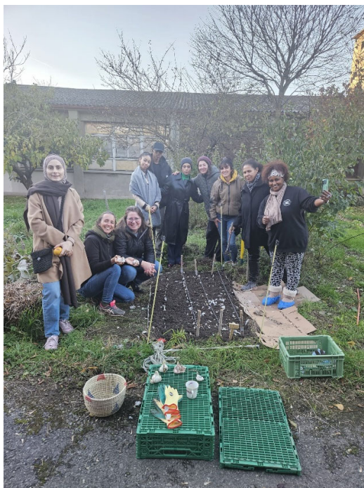
Atelier jardin participatif

ESCAPE lutte ainsi activement contre l'isolement social et la marginalisation, tout en renforçant la cohésion sociale à l'échelle locale. ESCAPE devient ainsi un pont entre des mondes qui se côtoient peu, favorisant la compréhension mutuelle et l'intégration.