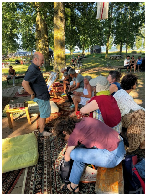
Ateliers 'Trigger points' contre les douleurs

La promotion de la santé passe également par la nutrition : les ateliers-discussions et les moments de cuisine partagée permettent de transmettre des connaissances simples, concrètes et adaptées aux réalités de vie des participant-exs.