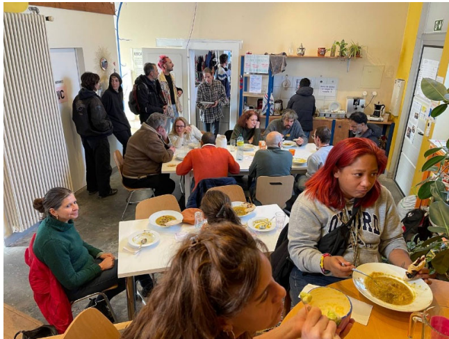
Repas en commun préparé par des bénéficiaires

Cette action répond directement à l'objectif de la Fondation DSR de soutenir la distribution de repas et de produits de première nécessité, tout en inscrivant cette aide dans une démarche durable, respectueuse de la santé et de l'environnement.