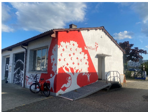
Case2santé, centre de santé gratuit

Un espace hygiène et vestimentaire – douches, buanderie et magasin de vêtements gratuit – complète cette approche globale de la santé. Pour les personnes sans logement ou mal logées, pouvoir se laver et laver ses vêtements est un geste essentiel, à la fois pour la santé physique, le droit à l'intimité, l'estime de soi et le maintien du lien social.