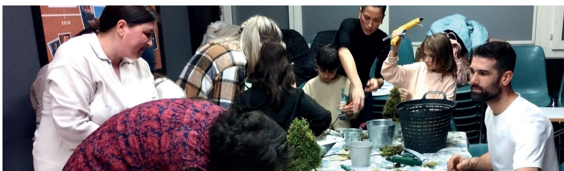
^ Animation, bricolages avec les enfants qui servira de déco de Noël chez eux.