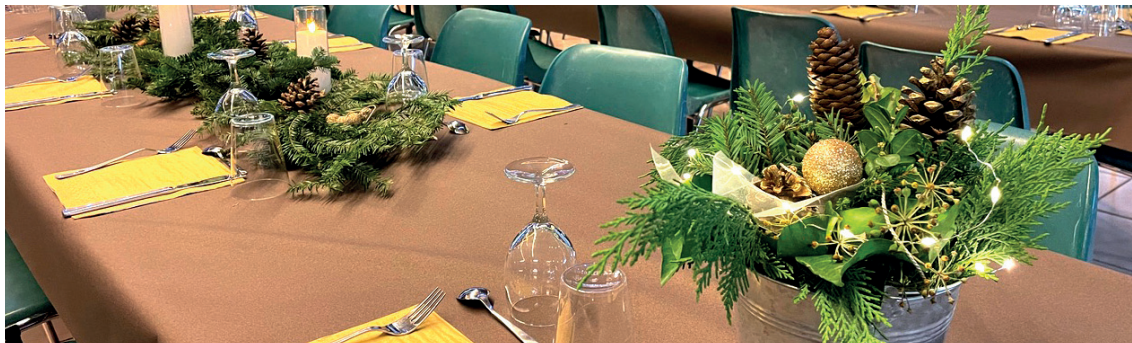
^ La décoration, un aspect important pour honorer les invités.