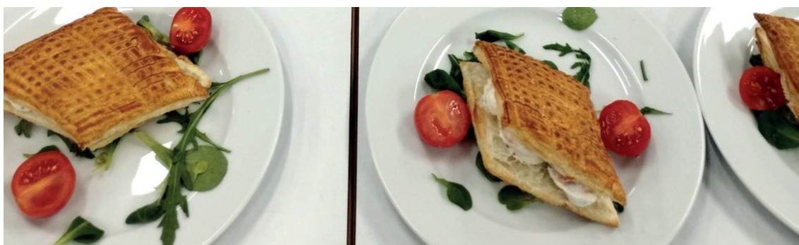
^ La cuisine, préparation des entrées avec une présentation soignée.